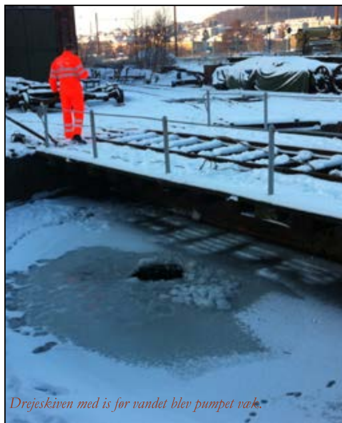
Drejeskiven med is før vandet blev pumpet væk.

Det samlede regnskabsresultat for 2012 er desværre et underskud på driften på omkring 25.500 kr.