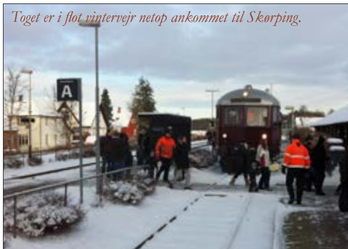
Toget er i flot vintervejr netop ankommet til Skørping.