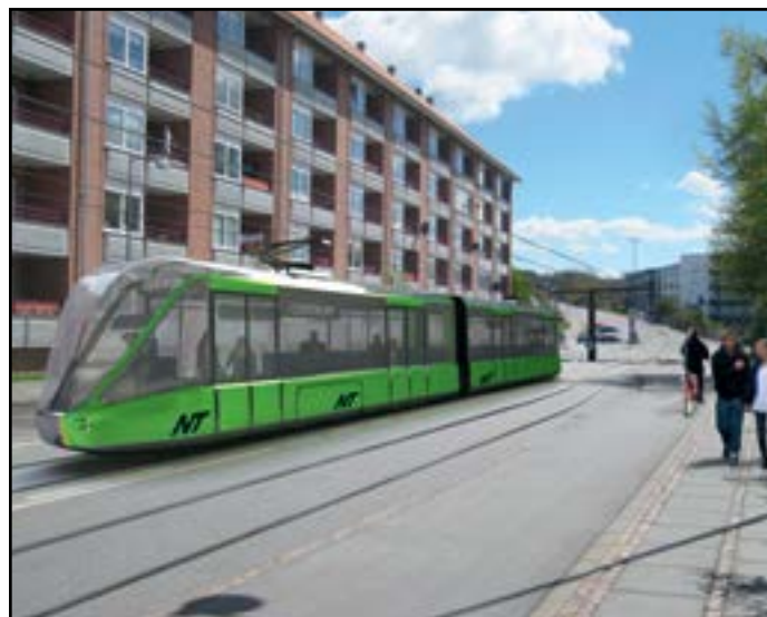
Fotomanipulation af letbanetog i Bornholmsgade i Aalborg.