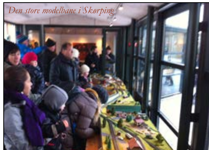
Den store modelbane i Skørping